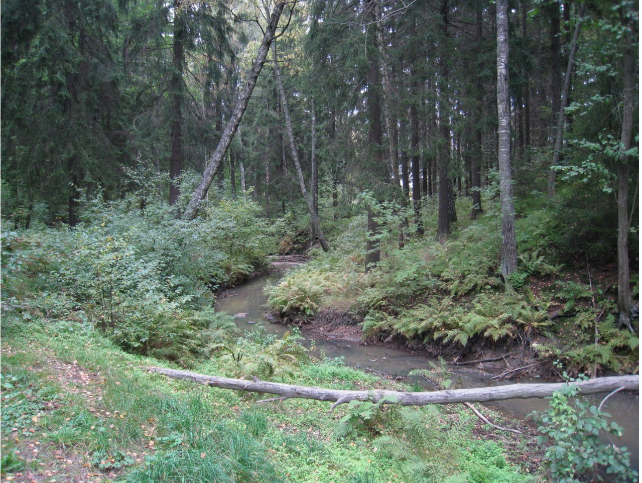
Kuva: Gammelbackan puro.