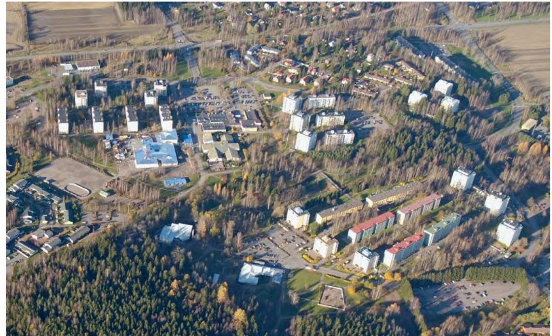
Snedflygbild 04931-095/ Borgå stad