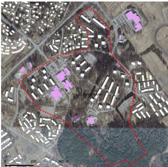
Kulturmiljöutredning för de centrala områdena i Borgå 2021

Delar av Gammelbacka gårds park har bevarats i den södra kanten av området. Herrgårdsparkens område har iståndsatts, så att de ståtliga ekarna, lindarna och lärkträden framträder bättre. Trädslags- och naturstigar har anlagts på området.