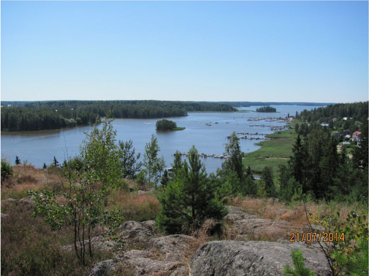
Yläkuva: kartanon vanhoja puukujanteita on edelleen näkyvillä. Alakuva: näkymä Tornbergetiltä etelään.