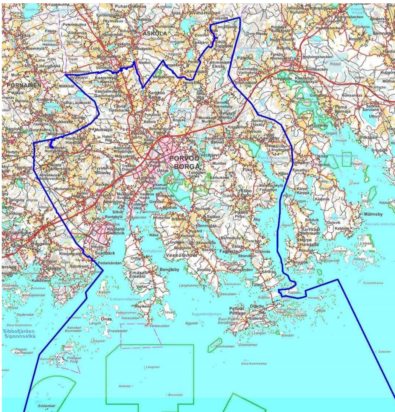
Kuva 1 Porvoon kaupungin kartta

Maankäyttö- ja rakennuslain (jatkossa MRL) 15§ mukaan rakennusjärjestyksen valmistelussa on sovellettava soveltuvilta osin kaavojen valmistelussa käytettävää vuorovaikutusmenettelyä.