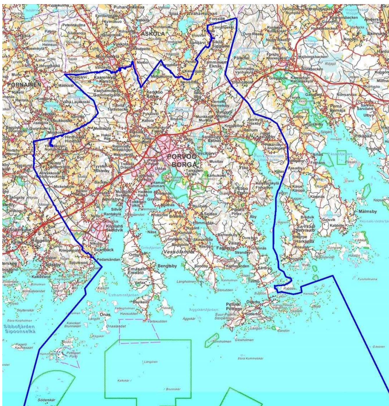
Bild 1 Karta över Borgå stad

Enligt markanvändnings- och bygglagens (i fortsättningen MarkByggL) 15 § när byggnadsordningen bereds skall i tillämpliga delar iaktas vad som bestäms om växelverkan.